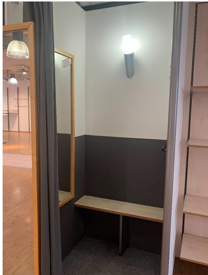
Zwei Umkleiden (siehe Fotos)