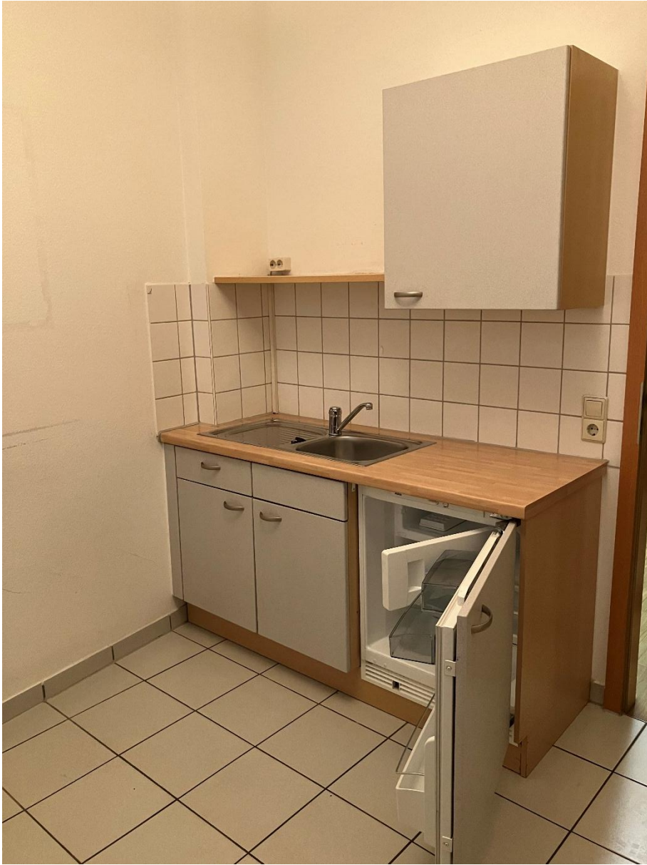
Singleküche mit Kühlschrank