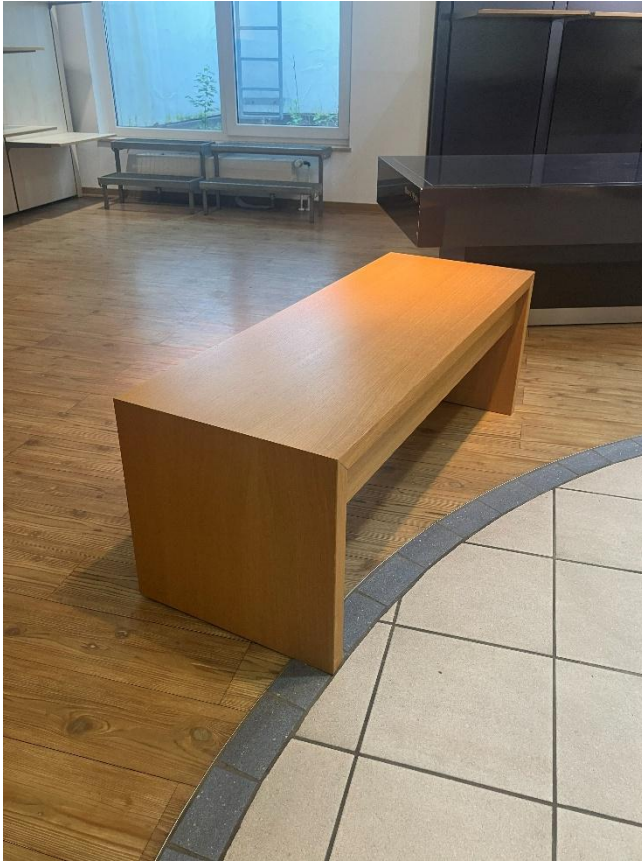
Holzbank (2 x vorhanden)