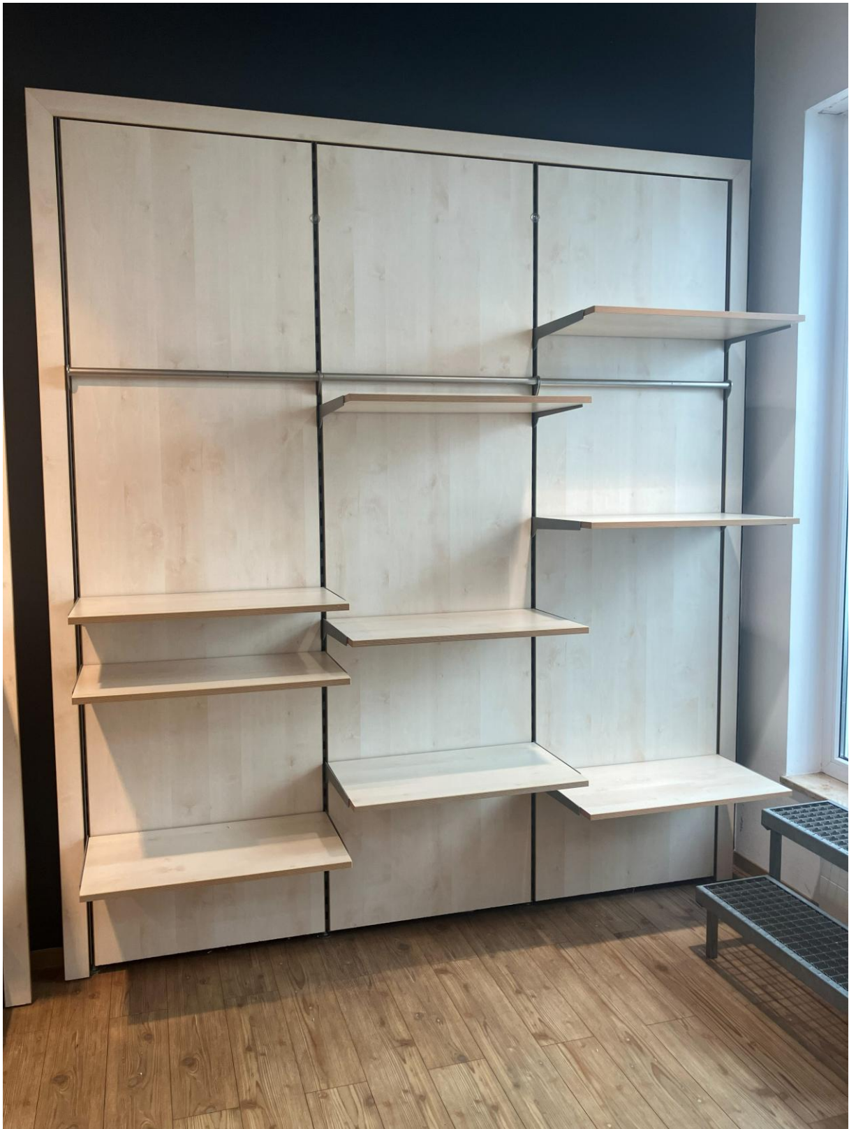
Wandregalsystem mit integrierter Holzwand